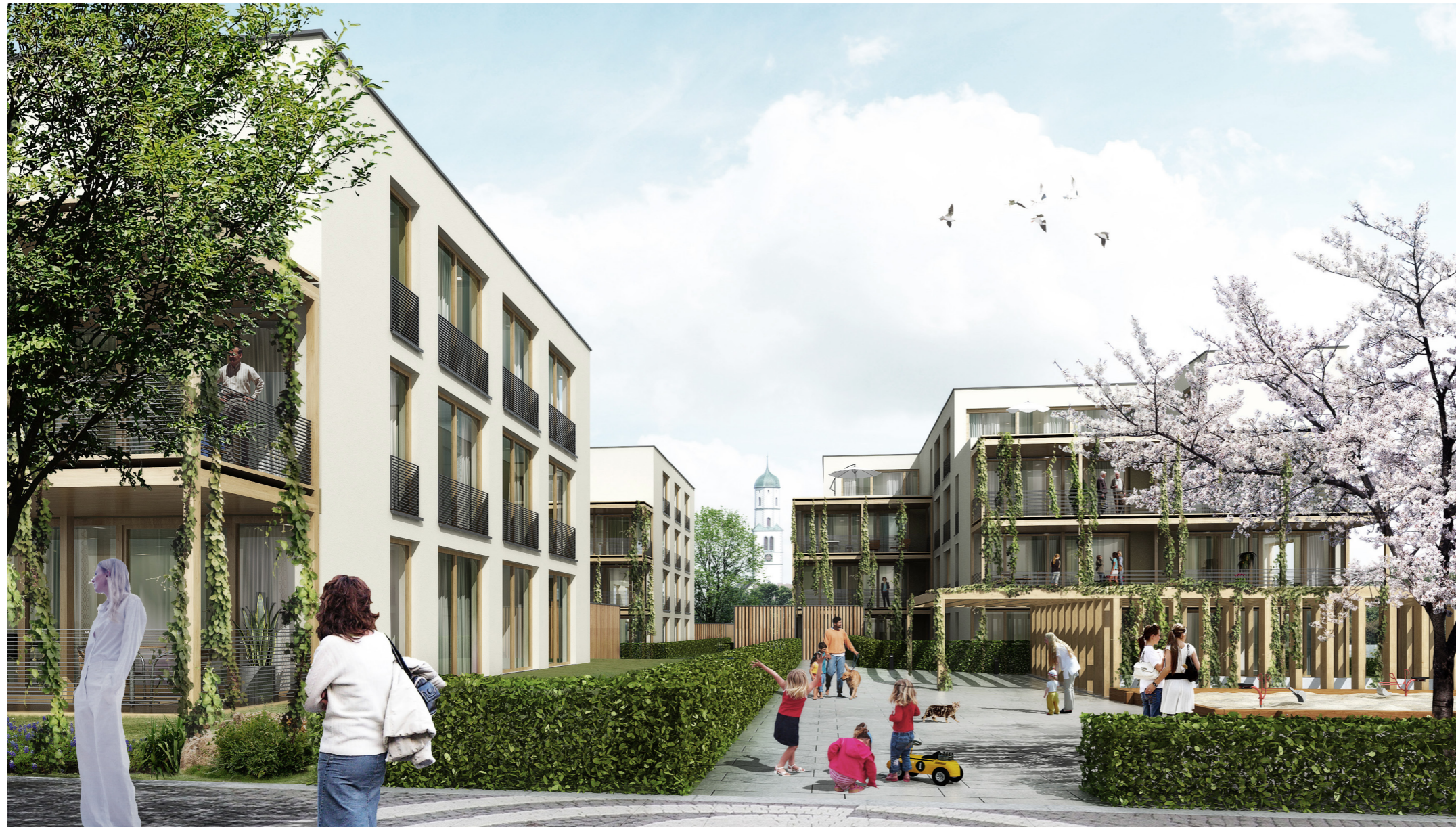
Blick von Süden

Ziel war es, innerhalb der Vielfalt unterschiedlicher Strukturen ein Quartier mit eigener, unverwechselbarer Identität zu schaffen. Das Quartier erhält neben einem zentralen Quartiersplatz auch einen Spiel- und Aufenthaltsbereich. Aus der Mitte des Quartiers besteht ein schöner Blick auf die Kirche und den Kirchturm der Friedenskirche. Das große Bauvolumen wird durch die Schaffung dreier klar geformter Baukörper aufgelockert. Jeder Baukörper wird in weitere Baukörperelemente gegliedert: Der „Grundbaukörper“ wird verputzt, Einschnitte im Dachgeschoss werden als weiße Putzflächen hervorgehoben. Dem Grundbaukörper vorgelagert wird ein formal eigenständiges Loggia-Element, welches sowohl in seiner Konstruktion als auch im Bereich des Bodenbelages durch das Material Holz geprägt ist.