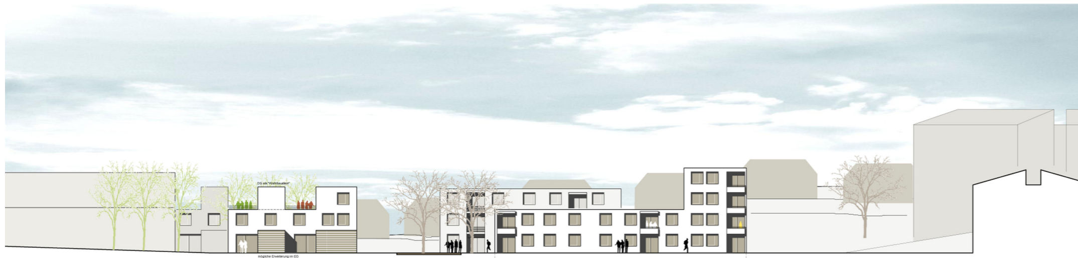
Ansicht aus Südrichtung

Auszug Preisgericht: Unter den Prämissen einer eher kleinteiligen Bebauungsstruktur und Ausrichtung der Gebäude nach Süden und Westen werden zwei Quartiere, orthogonal ausgerichtet, vorgeschlagen. Die Ausbildung der Eigenheime und Mehrfamilienhäuser als offene Zeilen beziehungsweise Winkelbauten erlaubt einen guten durchlässigen Übergang zur umgebenden Bebauung und eine angemessene Maßstäblichkeit. Die Haupteinschließung erfolgt als Stichstrassen. Diese werden durch Platzbildung und Gebäudeversätze angenehm gestaltet und bieten gute Aufenthaltsqualitäten und Möglichkeiten zur Identitätsbildung. Die gut geschnittenen und funktionalen Grundrisse des Geschosswohnungsbaus und der Stadthäuser werden begrüßt. Der dargestellte Außenbezug der Wohnungen zum privaten Freibereich mit seiner Süd/West-Orientierung unterstützt die hohe Wohnqualität. Begegnungs- und Treffpunkte sind in ausreichender und ausgewogener Weise über das ganze Nachbarschaftsquartier verteilt; auf den Wohn- und Spielstrassen kann sich Jung und Alt frei und ungestört bewegen und begegnen. Die Kenndaten sind gut nachprüfbar und liegen im optimalen Bereich.